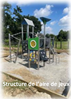
Structure de l'aire de jeux