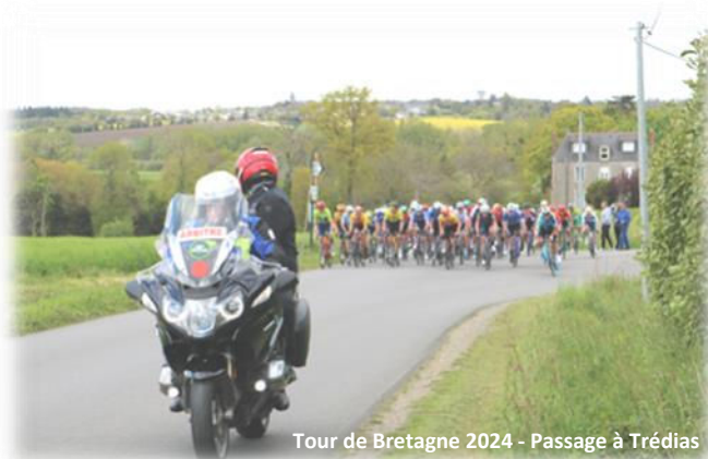
Tour de Bretagne 2024 - Passage à Trédias

Page 12: Etat-civil, Urbanisme et Calendrier des fêtes.